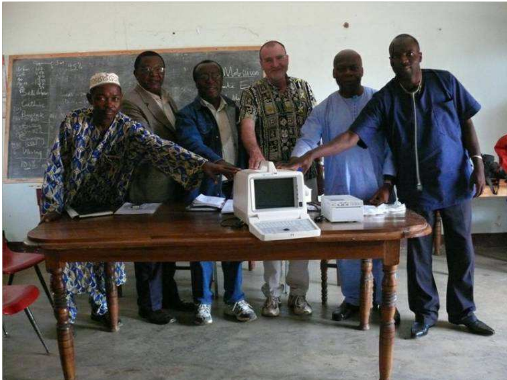
Übergabe Ultraschallgerät an das Bezirkskrankenhaus in Bali