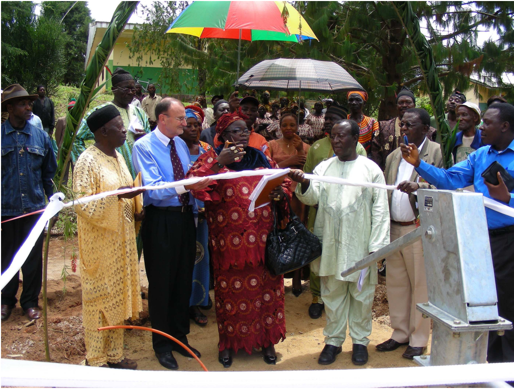
Übergabe Trinkwasserbrunnen in Gungong (auf dem Foto von links: Bürgermeister HPJ, Landrätin, EG)