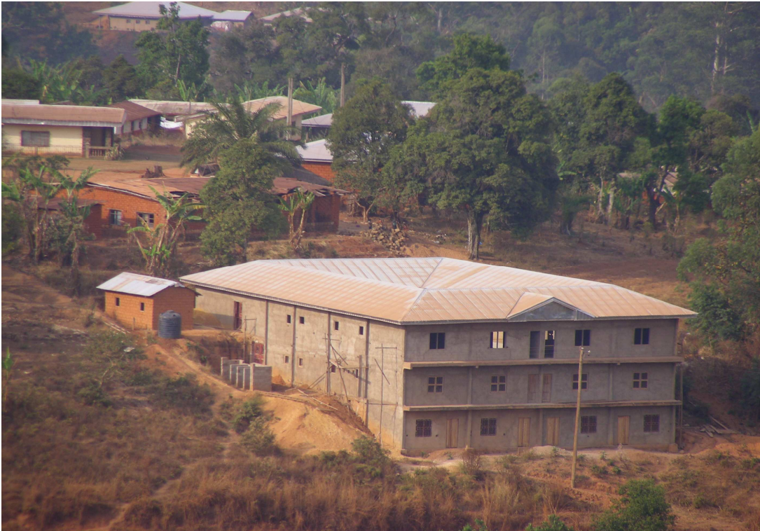
Rehazentrum BERIKIDS Kumbo