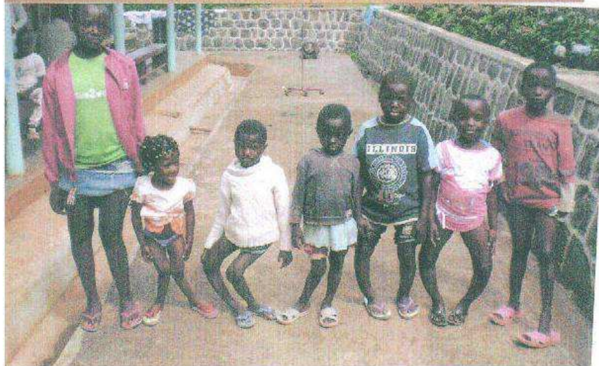
Patienten „nachher/vorher“ Kinder-Reha-Zentrum Sajocah